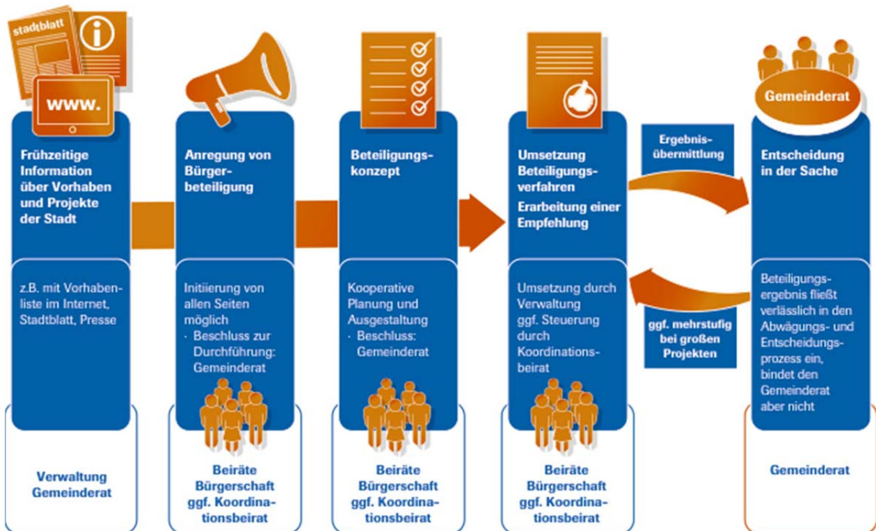
Abbildung 1: standardisierter Ablauf mitgestaltender Bürgerbeteiligung in Heidelberg

Mit dem Begriff „Verwaltung“ werden in diesen Leitlinien der Oberbürgermeister, die Bürgermeister sowie die Mitarbeiterinnen und Mitarbeiter in den jeweiligen Fachämtern bezeichnet.