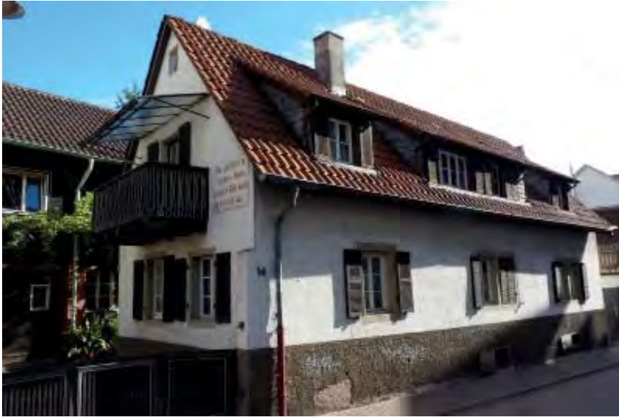
Brückenkopfstraße 16 Flurstück 5393

Ehemaliges landwirtschaftliches Anwesen, eingeschossiges Wohnhaus von 1746, Schuppen von Mitte 19.Jhd. mit Klinkerfassade und Holzverschalung