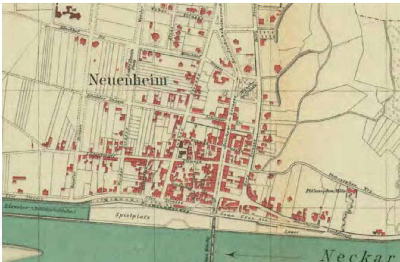
Stadtplan von 1893

Trotz Überformungen und mehrgeschossigen Neubauten der Gründerzeit ist eine relativ große Anzahl von kleinteiligen dörflichen Gebäuden und Strukturen erhalten geblieben, die sich heute fast nur noch in diesem Bereich des ehemaligen Dorfkerns um den Marktplatz von Neuenheim befindet.