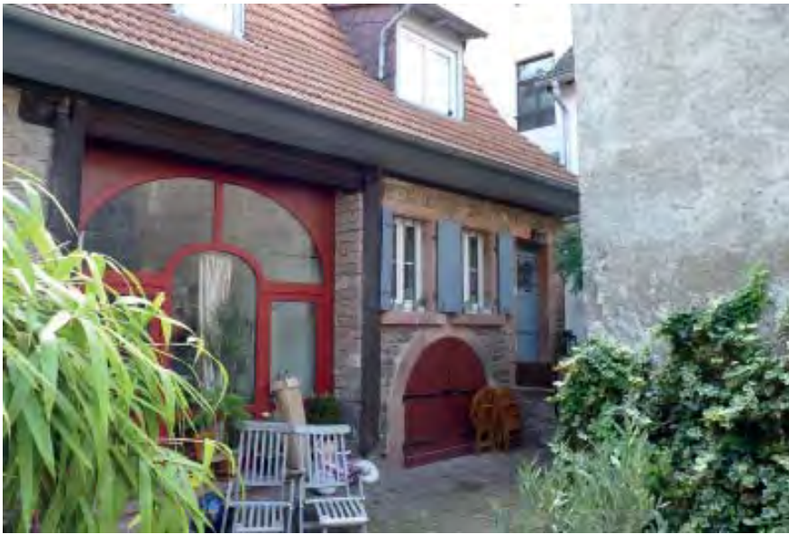
Sackgasse 4 Flurstück 5442/2

Vermutlich ehemaliges landwirtschaftliches Anwesen mit Wohngebäude und Scheunenanbau errichtet um 1794, deutliche Renovierungszeichen aus den letzten Jahren erkennbar 1 Vollgeschoß, mit erhöhtem Zugang bei dem Wohngebäude