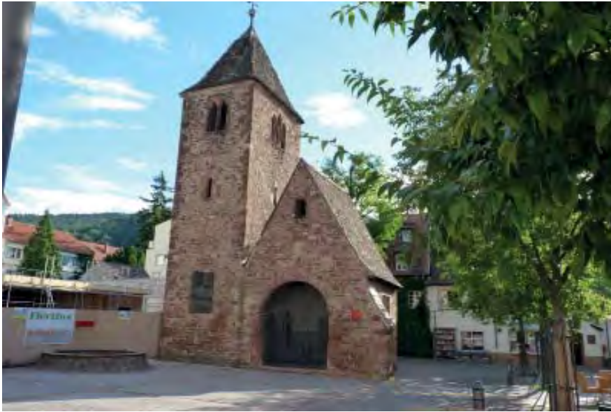
Lutherstraße 16 Flurstück 5409

Die alte Johanneskirche auf dem heutigen Marktplatz in Neuenheim- die erhaltenen baulichen Reste stammen von einem gotischen Bau aus dem späten 15. Jahrhundert