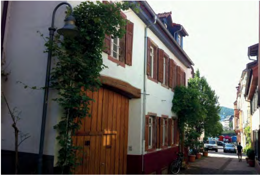
Schulzengasse 8 Flurstück 5453

Wohnhaus von 1802, erhaltener Gewölbekeller mit Lehmboden, Hochparterre, 2 Vollgeschosse.