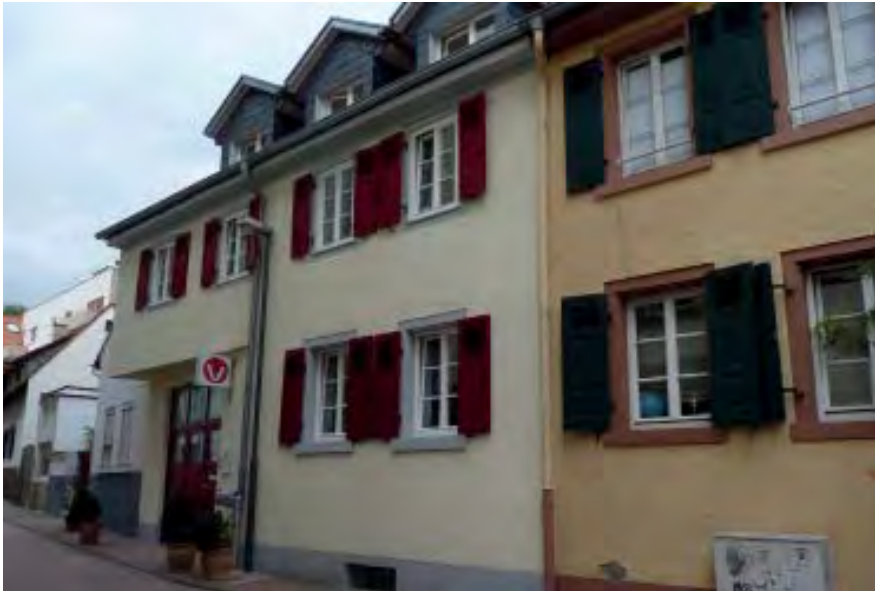
Brückenkopfstraße 8 Flurstück 5399

Anwesen mit Vorder- und Hinterhaus von ca. 1790. 1964 im Hof kleiner Ergänzungsbau, 2011 Umbau und Erweiterung des Hinterhauses, Umbau und Dachausbau des Vorderhauses. 2 Vollgeschosse