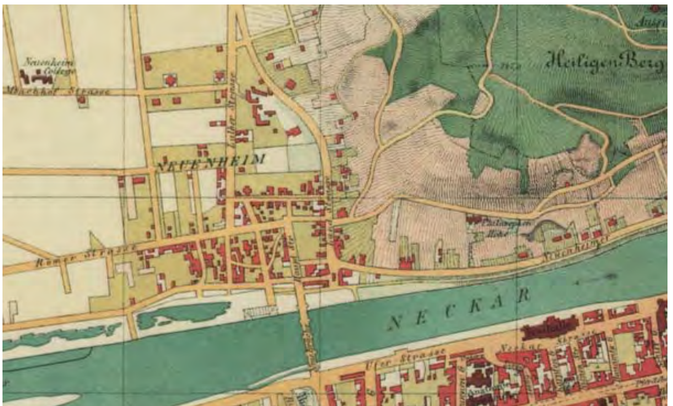
Plan von 1888