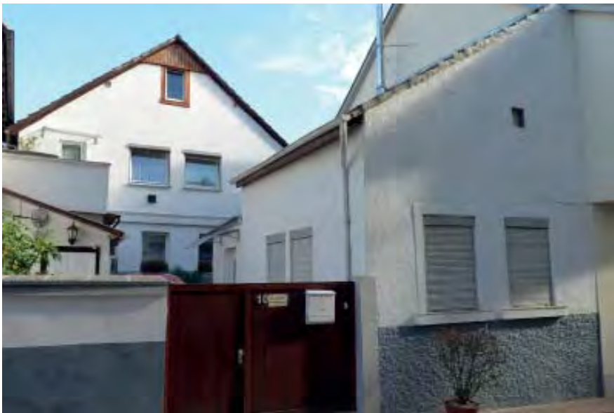
Brückenkopfstraße 10 Flurstück 5398

Ehemaliges landwirtschaftliches Anwesen, Wohnhaus von 1744 mit altem Gewölbekeller, 1927 auf 2 Vollgeschosse umgebaut, Schuppen von 1869, kleiner Ergänzungsbau mit Balkon von 1959.