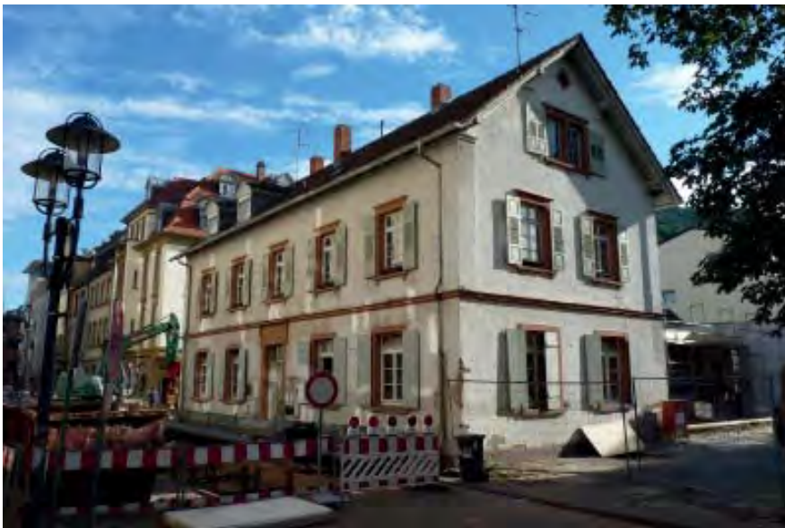
Lutherstraße 18 Flurstück 5410

Die alte Johanneskirche auf dem heutigen Marktplatz in Neuenheim- die erhaltenen baulichen Reste stammen von einem gotischen Bau aus dem späten 15. Jahrhundert