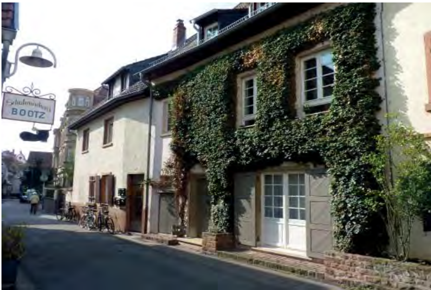
Schulzengasse 11a Flurstück 5407/1

Ehemaliges 1- geschossiges Lagergebäude von Schulzengasse 11, Aufstockung 1948 zu Wohnzwecken, erneuter Umbau und Anheben des Dachstuhles mit Fassadenveränderung 1984.