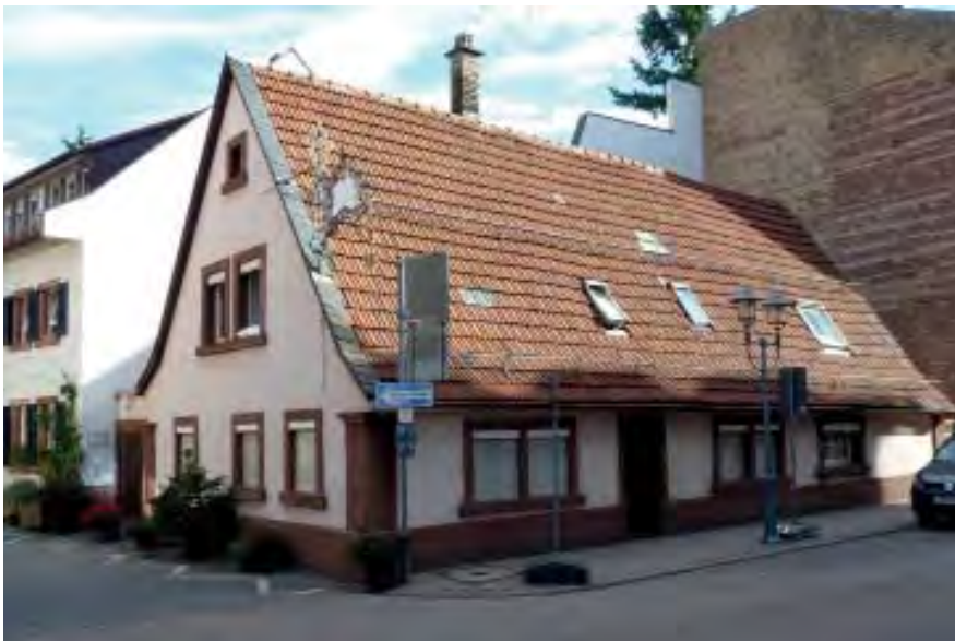
Ladenburger Straße 14 Flurstück 5460/2

Wohnhaus 1693 nach Brand wieder aufgebaut - 1 sehr niedriges Vollgeschöß.