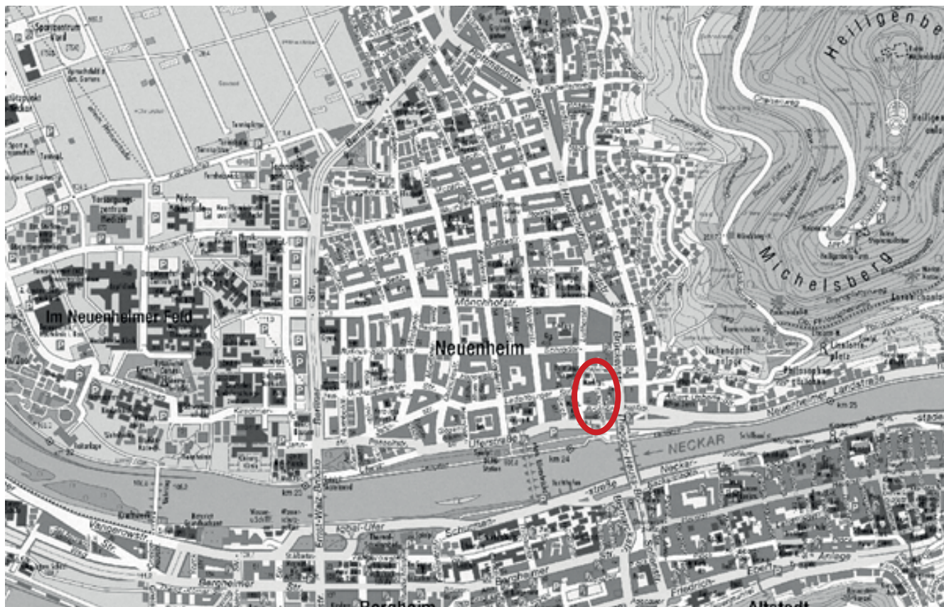
Stadtplan von Heidelberg mit dem Fokus auf den Stadtteil Neuenheim und dem markierten Gebiet

Das heutige "städtische" Erscheinungsbild gewann Neuenheim bereits aus seiner vor der Eingemeindung einsetzenden städtebaulichen Entwicklung, die sich im Zeichen gründerzeitlicher Stadterweiterung vollzog. Heute wohnen in Neuenheim 13.500 Einwohner. (Stand 31.12.2010)