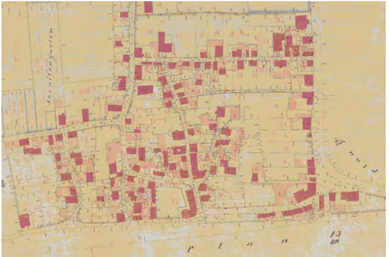
Der älteste nach modernen Vermessungsmethoden erstellte Ortsplan Neuenheims von 1874