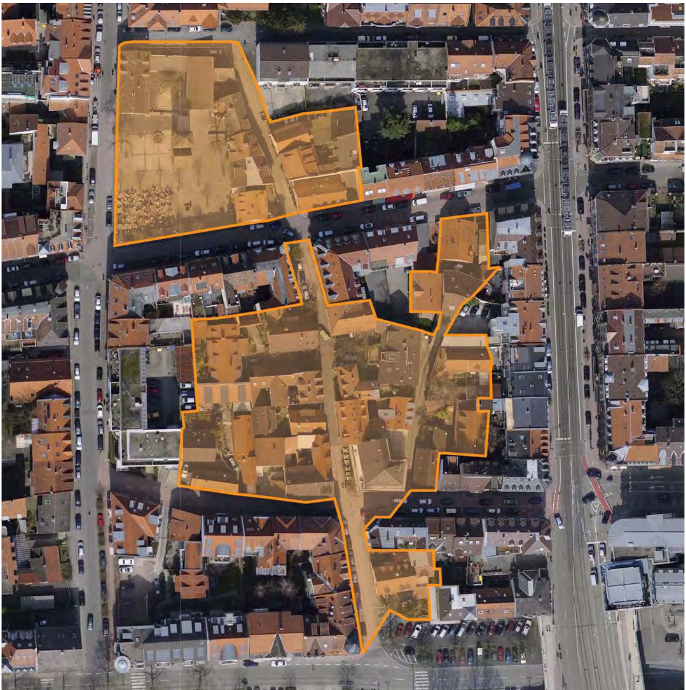
Geltungsbereich in der Luftaufnahme markiert

Der Geltungsbereich ist darüber hinaus in beiliegendem Lageplan, Anlage 2 gekennzeichnet. Die Anlagen 1 und 2 sind Bestandteil der Satzung.