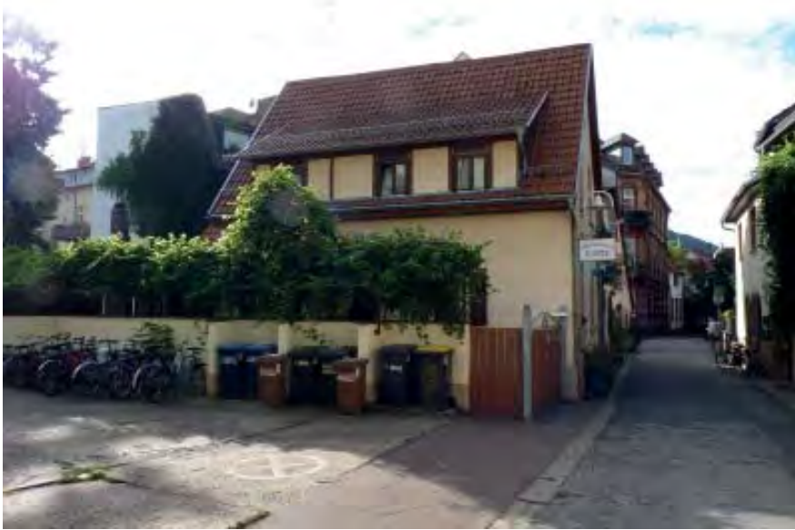
Schulzengasse 18 Flurstück 5462

Gewölbekeller des ehemaligen Wohnhauses von 1782 erhalten. Heute "Schuhmacherei Bootz", - 1 Vollgeschoß.