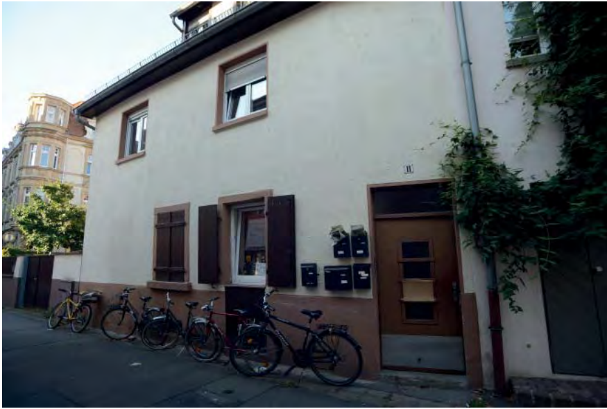
Schulzengasse 11 Flurstück 5407

Wohnhaus von 1733 war ursprünglich ein Flurstück mit der benachbarten heutigen Nr. 11a, wurde 1953 erst geteilt. Bei dem Umbau wurden die typischen Proportionen verändert durch Aufstockung. Früher war der Baukörper giebelständig zur Schulzengasse- (ursprünglich eingeschossig) heute 2 Vollgeschosse.