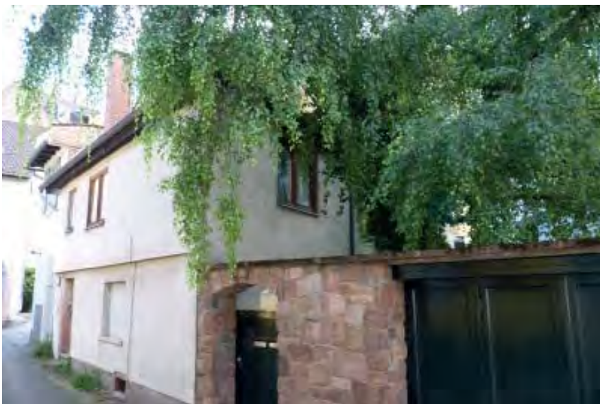
Sackgasse 6 - Flurstück 5440 Sackgasse 8 - Flurstück 5439/2

Wohnhäuser errichtet um 1728 mit 2 Vollgeschossen. Sackgasse 8 hat 1932 einen Schuppen ergänzt