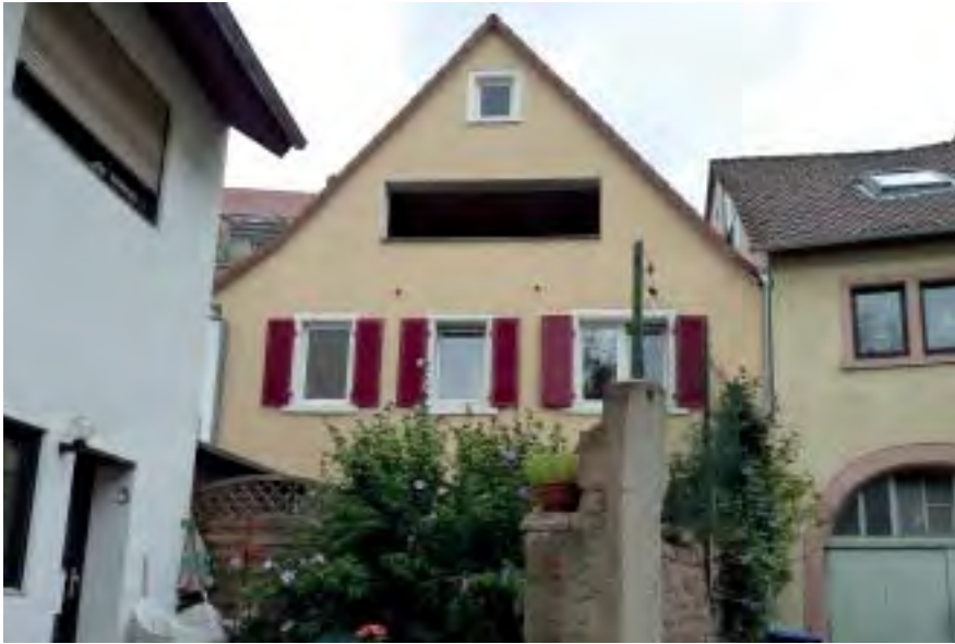
Ladenburger Straße 9 Flurstück 5456

Hinterhaus sogenanntes „altes Wohnhaus“ vermutlich aus dem 19. Jahrhundert – 1992 wurden verschiedene Umbaumaßnahmen am Bestand durchgeführt. 2 Vollgeschosse.